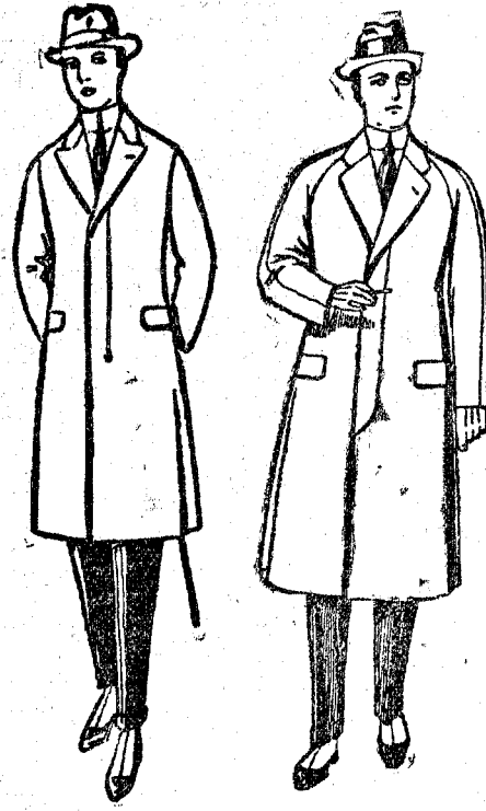
Gabán hecho, de lana cheviot con cinturón forro sa-tén. . . Ptas. 70. Neto Ptas. 59'50